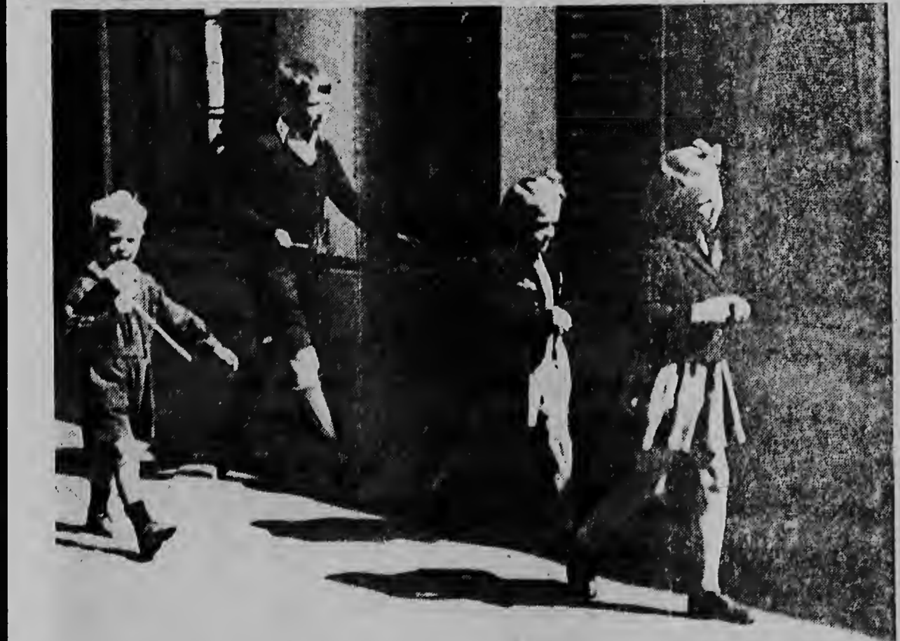
Aki nos por welta e Prinsesnan Beatrix y Irena hungando libremente riba esja na Soestdijk coe algun amigos den e vecindario. Y esey nan por haer bon tambe. Nan ta tabata masha bualdadi?